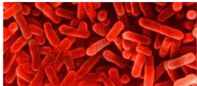
Opname met de fluorescentie-microscopie van een bacteriële biofoulinggemeenschap en van een Legionella kweek.