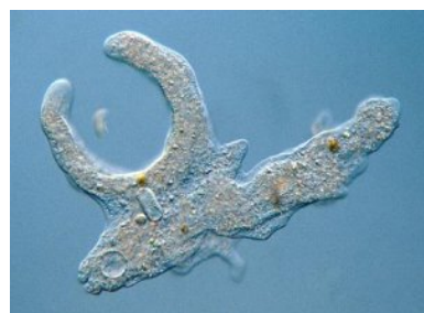
Amoeben predatoren o.a. op biofouling bacteriën.